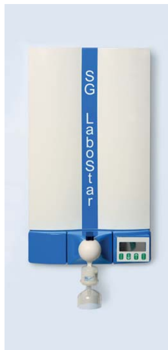
Falra szerelhető kivitel

SG LaboStar TWF UV mikro és molekuláris biológia, PCR, HPLC, TOC analízis.