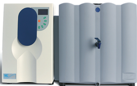
EuRO víztisztító 60 literes tartállyal

Compact RO/DI: a fentiekén kívül általános kémiai vizsgálatokhoz, táptalajok készítése