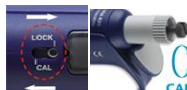
Gyors és egyszerű újrakalibrálás

A pipetták nyolc méret tartományban kaphatók: