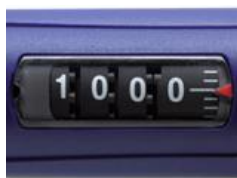
Jól látható kijelző